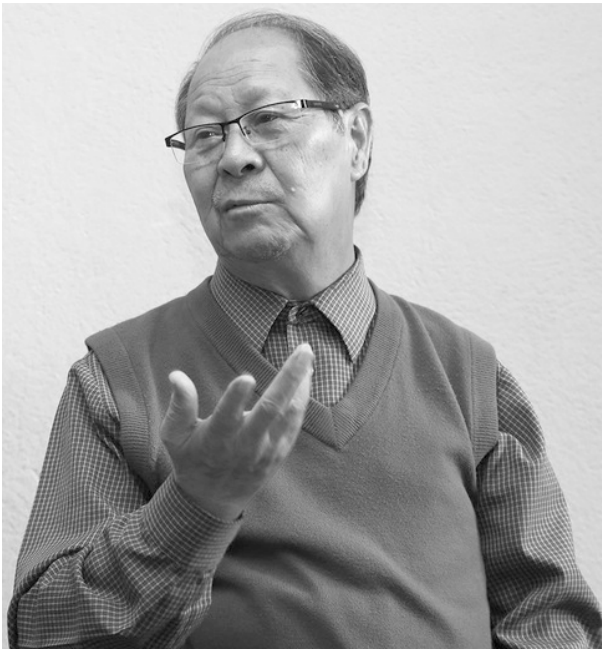
नभएसम्म नेपालीको उलागि खुशी नआउने विचार राख्नुभयो ।

पञ्चायत कालदेखिका प्रमहरूले भारत भ्रमणपछि प्रफुल्लित भएर आउने गरेको उल्लेख गर्दै सत्ताधारी पार्टीका केन्द्रीय सदस्यहरूको को भारतबाट पालितपोषित छन् भन्ने निकर्वाल