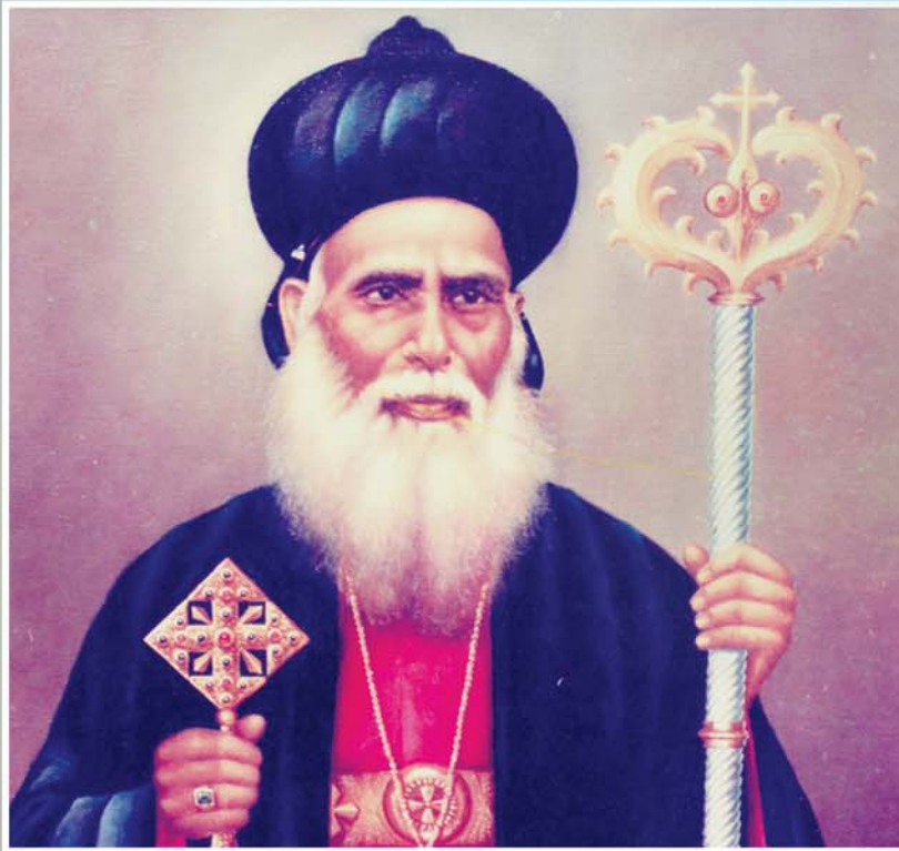
പ. ബസേലിയോസ് തിരുവിതീരത്ത് പ്രഥമൻ കാതോലിക്കാ ബാവ (83-ാം ഓർമ്മ, ഡിസംബർ 17 വള്ളിക്കാട്ട് ദയറയിൽ )