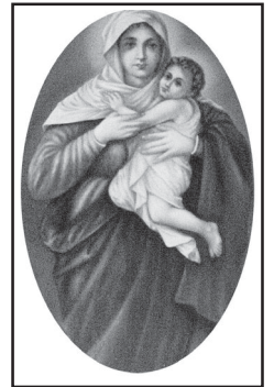
സെന്റ് മേരീസ് യുവജനപ്രസ്ഥാനം കാരാട്ടുകുന്നേൽ

വി. ദൈവമാതാവിന്റെ മദ്ധ്യസ്ഥതയിൽ അഭയം പ്രാപിച്ചുകൊണ്ട്