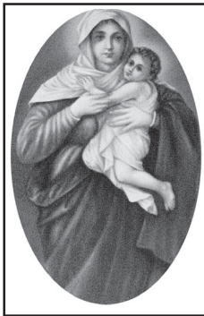
കൊച്ചുമോനും കുടുംബവും തോട്ടുകൽ

വി. ദൈവമാതാവിന്റെ മദ്ധ്യസ്ഥതയിൽ അഭയം പ്രാപിച്ചുകൊണ്ട്