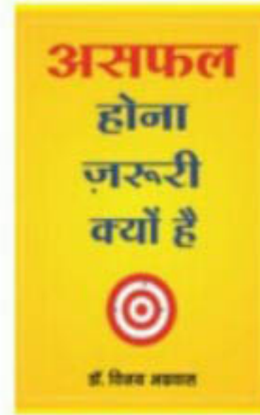
'असफल होना ज़रूरी क्यों है' मूल्य, रु. 175/-