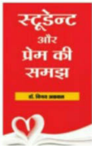
'स्टूडेंट और प्रेम की समझ' मूल्य, रु. 135/-