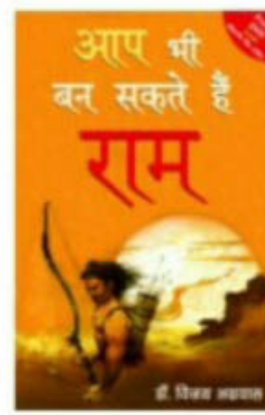
'आप भी बन सकते हैं राम' मूल्य, रु. 175/-

यह पुस्तकें किताब-दुकान में न मिलने पर संपर्क करें- फोन- 0755-4245626