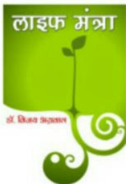
'लाइफ मंत्रा' मूल्य, रु. 150/-