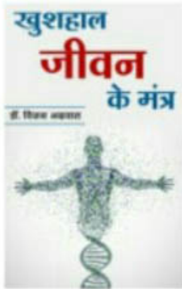
'खुशहाल जीवन के मंत्र' मूल्य, रु. 150/-