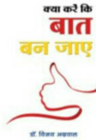
'क्या करें कि...बात बन जाए' मूल्य, रु. 175/-