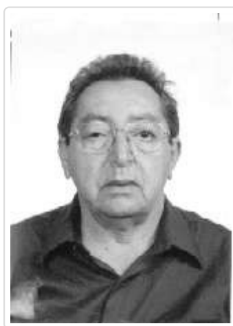
Foto para urna